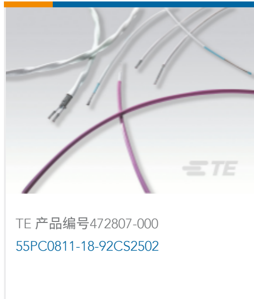
TE 产品编号472807-000 55PC0811-18-92CS2502