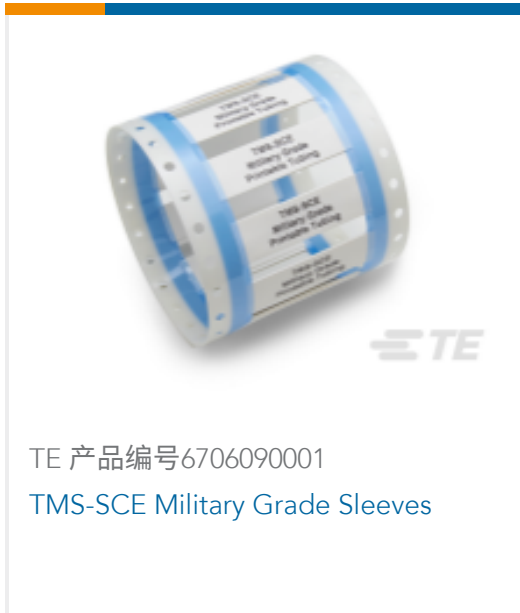
TE 产品编号6706090001 TMS-SCE Military Grade Sleeves