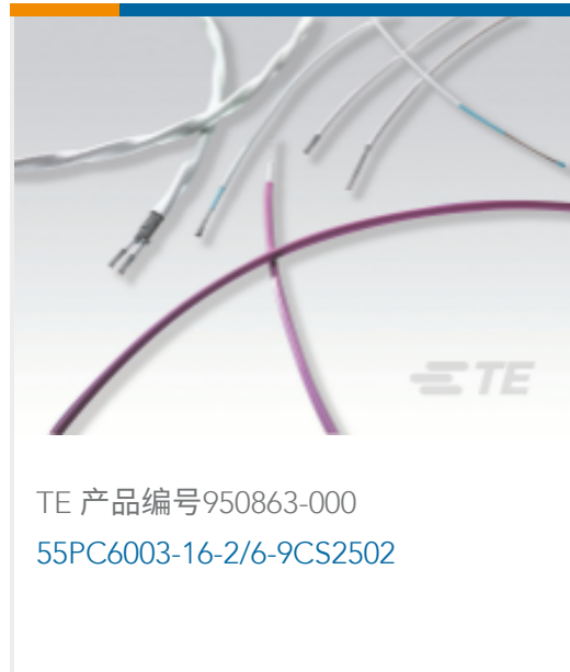
TE 产品编号950863-000 55PC6003-16-2/6-9CS2502