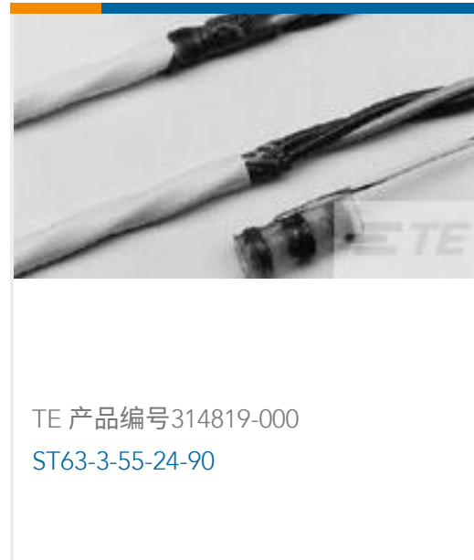
TE 产品编号314819-000 ST63-3-55-24-90