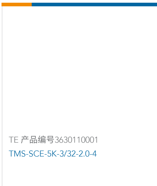
TE 产品编号3630110001 TMS-SCE-5K-3/32-2.0-4