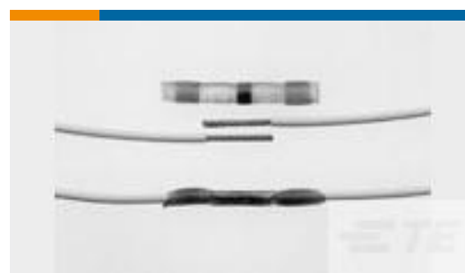
TE 产品编号F80600-000 B-152-9004