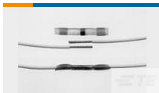
TE 产品编号D33598-000 B-152-9003