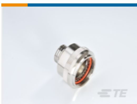
TE 产品编号70A1-20-16-1-B 70A1-20-16-1-B