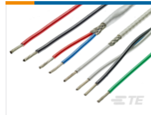
TE 产品编号109761-000 44A0141-20-9/90/92/96