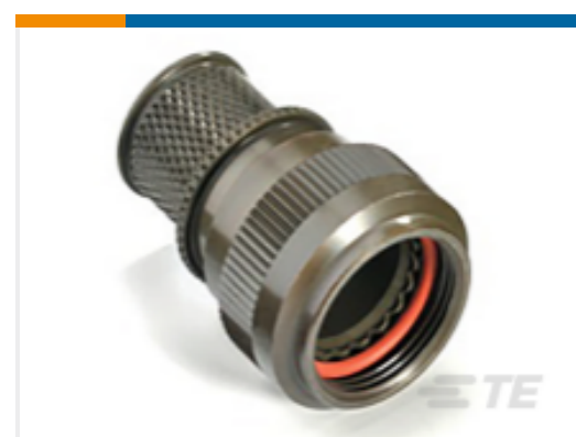
TE 产品编号BTH1-15-08-1-ZN BTH1-15-08-1-ZN