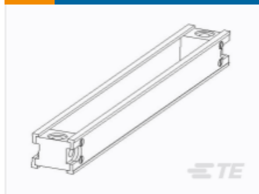
TE 产品编号JF13E-01-08 FRAME ASSY