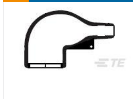
TE 产品编号878145-000 222K185-12-0