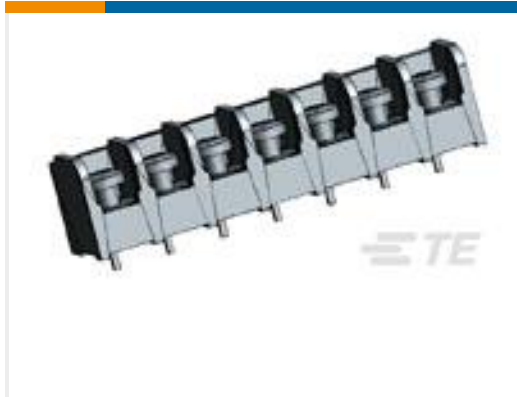
TE 产品编号1-1437658-1 8PCV-07-006=#8 TRIBARRIER