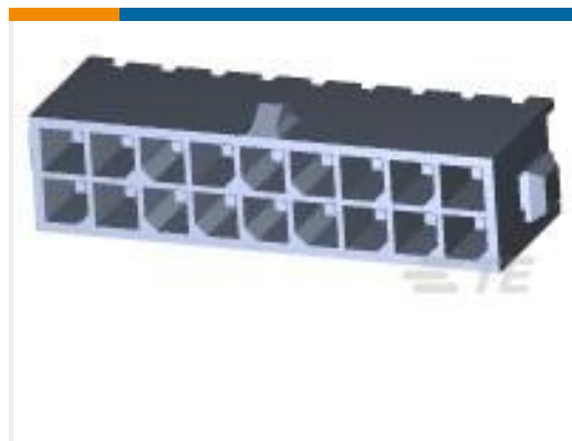
TE 产品编号4-794630-8 18P MICRO MNL ASSY,VRT,HDR,LF