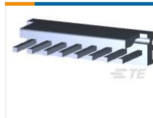
TE 产品编号640445-8 08P MTA156 HDR ASSY FL/STR SN