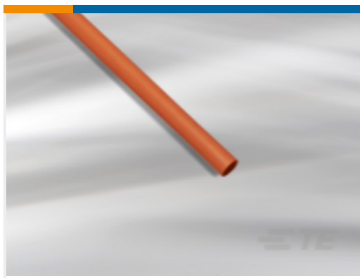
TE 产品编号EM63332001 BATTU-12.7/6.1-A1-3-STK