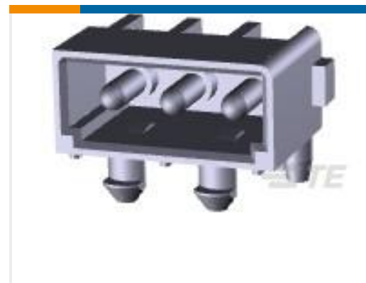
TE 产品编号643488-1 03P CMNL HDR ASSY R/A