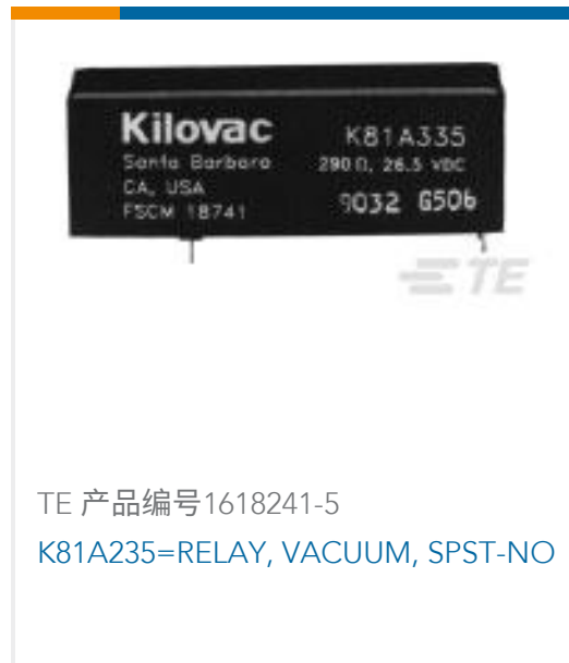
TE 产品编号1618241-5 K81A235=RELAY, VACUUM, SPST-NO