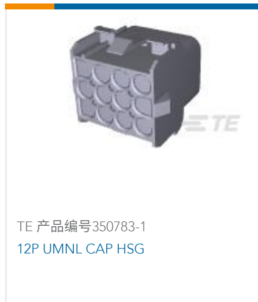
TE 产品编号350783-1 12P UMNL CAP HSG