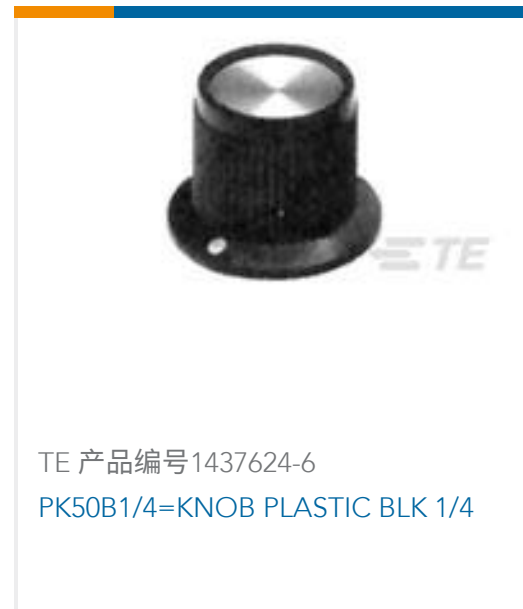
TE 产品编号1437624-6 PK50B1/4=KNOB PLASTIC BLK 1/4