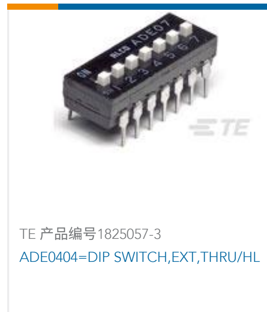
TE 产品编号1825057-3 ADE0404=DIP SWITCH,EXT,THRU/HL