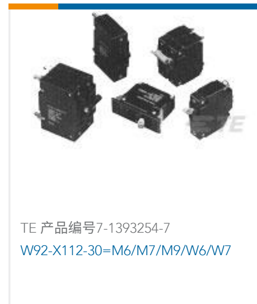
TE 产品编号7-1393254-7 W92-X112-30=M6/M7/M9/W6/W7