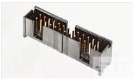
TE 产品编号2-1761603-7 IDC LOW PRO HDR 20P VERT BLUE