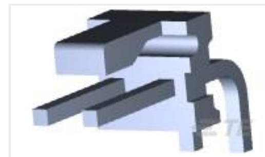
TE 产品编号3-644754-2 02P MTA156 HDR ASSY SQ R/A F/L