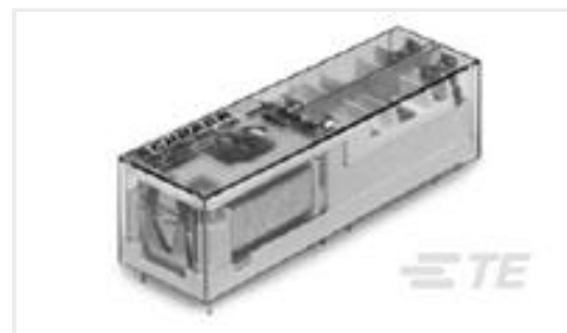
TE 产品编号1415015-1 SR6A4024 - V23050-A1024-A533