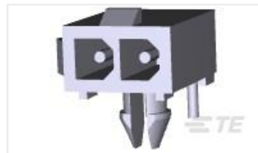
TE 产品编号1-770966-0 02P MINI UMNL R/A HDR ASSY SN