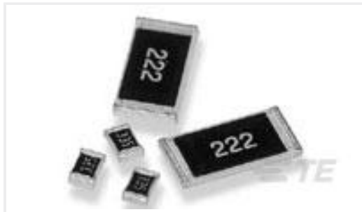
TE 产品编号1623096-1 CRG0805 1% 100R