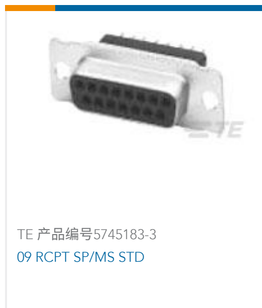
TE 产品编号5745183-3 09 RCPT SP/MS STD