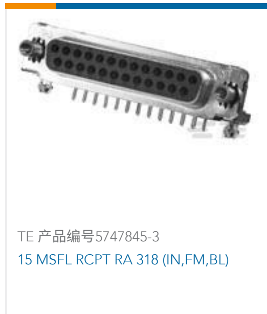
TE 产品编号5747845-3 15 MSFL RCPT RA 318 (IN,FM,BL)