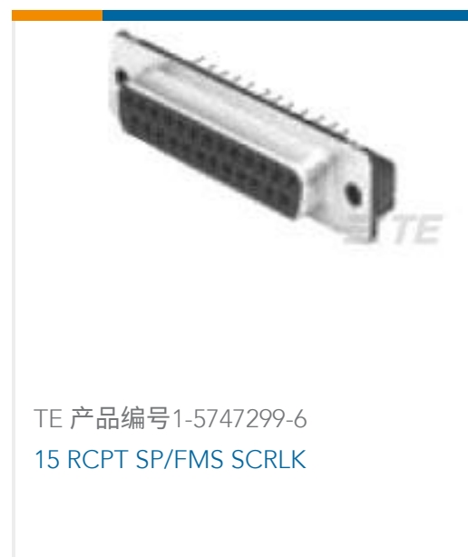
TE 产品编号1-5747299-6 15 RCPT SP/FMS SCRLK