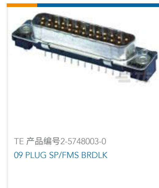
TE 产品编号2-5748003-0 09 PLUG SP/FMS BRDLK