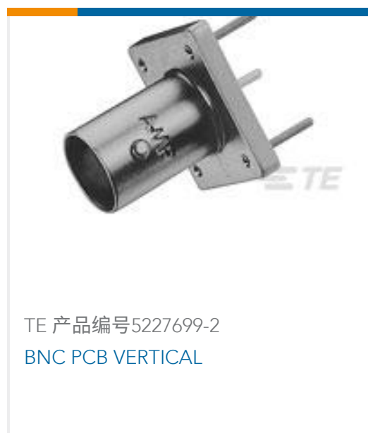
TE 产品编号5227699-2 BNC PCB VERTICAL