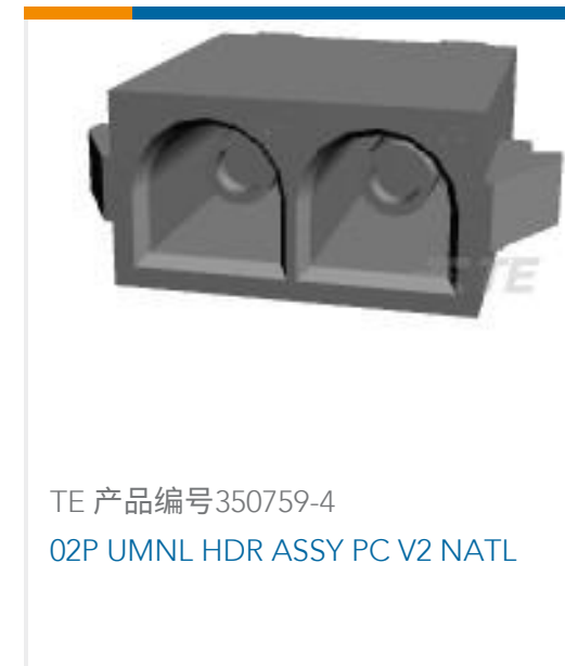
TE 产品编号350759-4 02P UMNL HDR ASSY PC V2 NATL