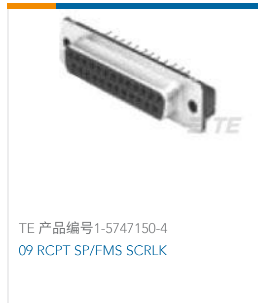
TE 产品编号1-5747150-4 09 RCPT SP/FMS SCRLK