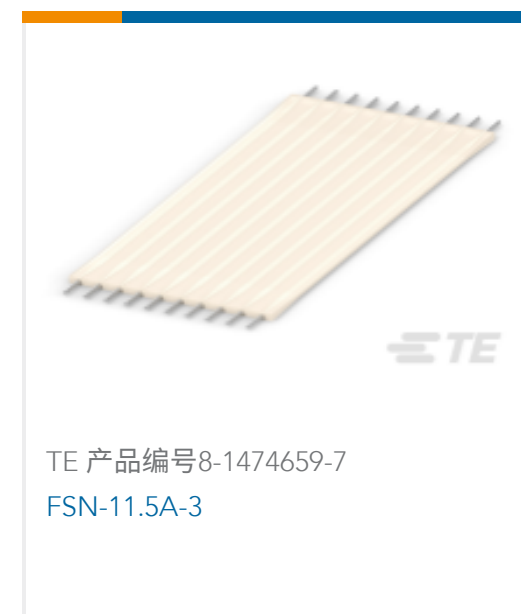
TE 产品编号8-1474659-7 FSN-11.5A-3