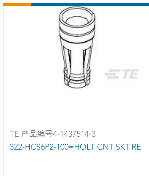
TE 产品编号4-1437514-3 322-HCS6P2-100=HOLT CNT SKT RE