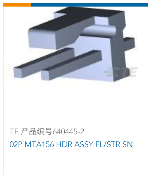
TE 产品编号640445-2 02P MTA156 HDR ASSY FL/STR SN