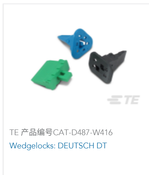
TE 产品编号CAT-D487-W416 Wedgelocks: DEUTSCH DT