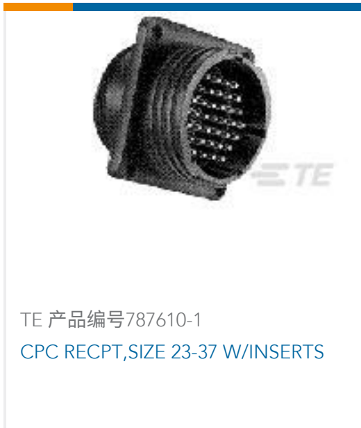
TE 产品编号787610-1 CPC RECPT, SIZE 23-37 W/INSERTS