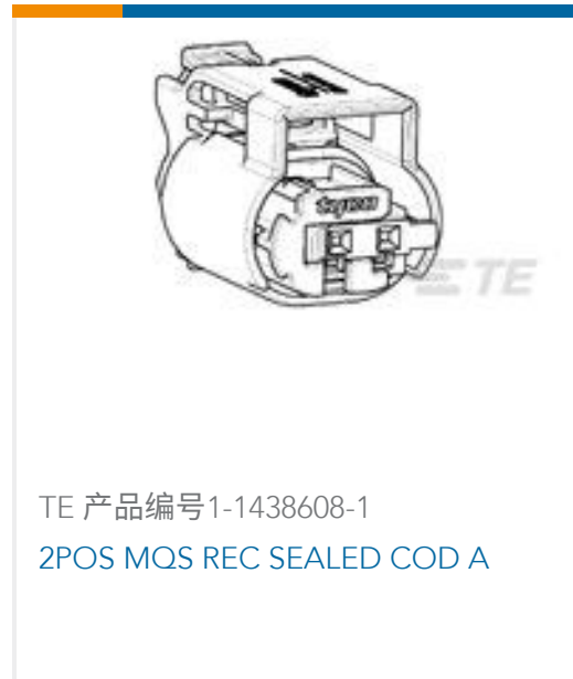
TE 产品编号1-1438608-1 2POS MOS REC SEALED COD A