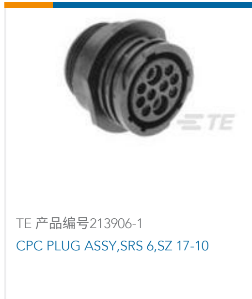
TE 产品编号213906-1 CPC PLUG ASSY, SRS 6, SZ 17-10