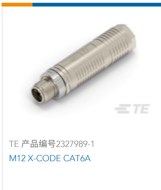
TE 产品编号2327989-1 M12 X-CODE CAT6A