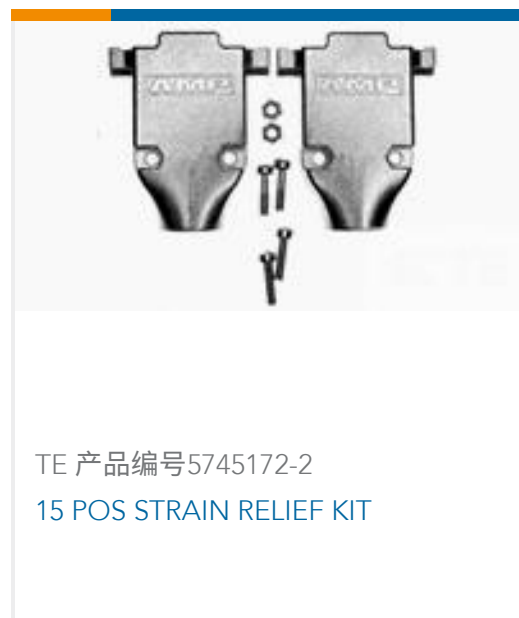
TE 产品编号5745172-2 15 POS STRAIN RELIEF KIT