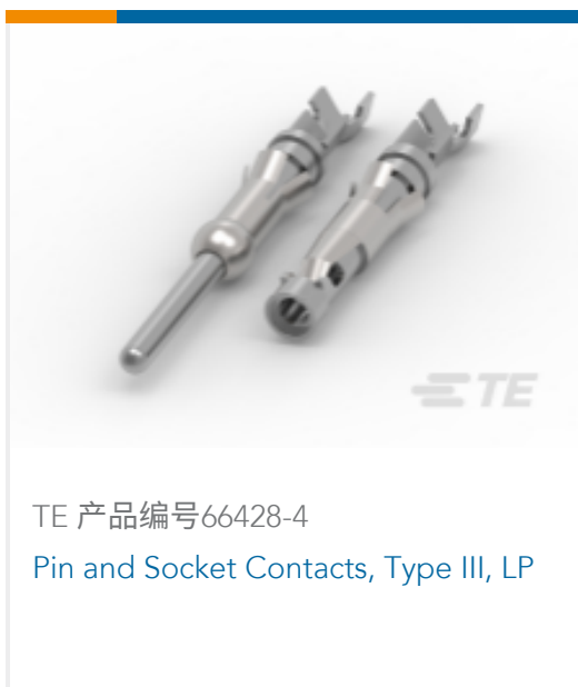
TE 产品编号66428-4 Pin and Socket Contacts, Type III, LP