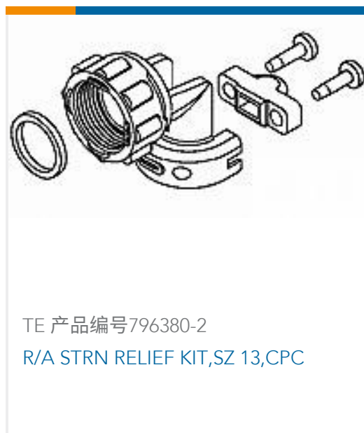
TE 产品编号796380-2 R/A STRN RELIEF KIT, SZ 13, CPC