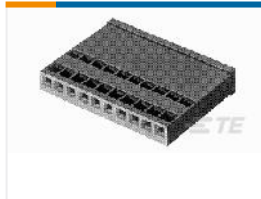
TE 产品编号2-87175-2 10 LOCKING CLIP HSG SR .100CL