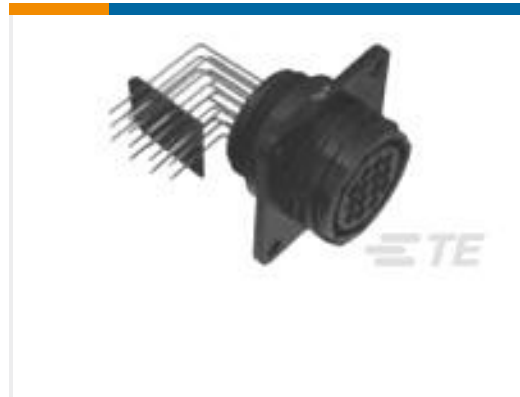
TE 产品编号1776904-1 CPC POSTED RCPT,17-16,R/A