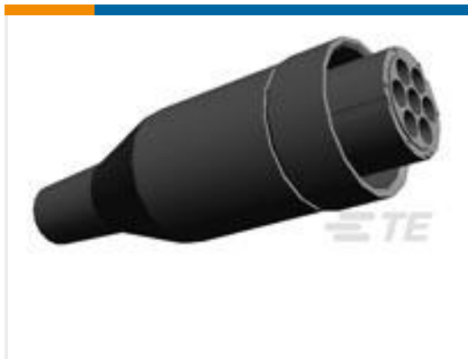
TE 产品编号865656-1 7 PIN MIN PLUG KIT