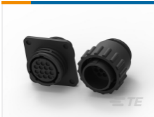
TE 产品编号206037-1 Circular Connector, Environmentally Sealed, CPC Series 6