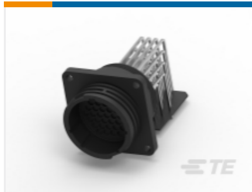
TE 产品编号1-796406-1 Connectors with Posted Pin Contacts, CPC Series 1