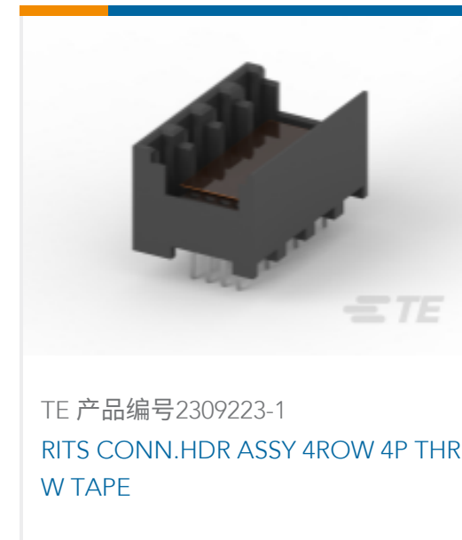
TE 产品编号2309223-1 RITS CONN.HDR ASSY 4ROW 4P THR W TAPE