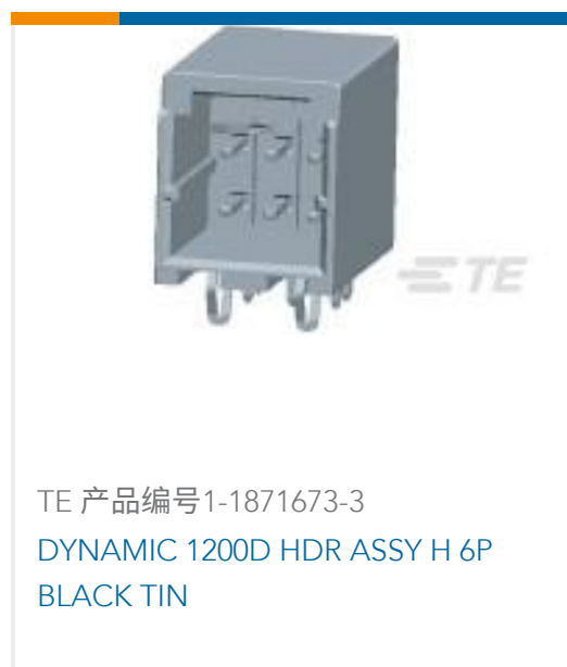
TE 产品编号1-1871673-3 DYNAMIC 1200D HDR ASSY H 6P BLACK TIN