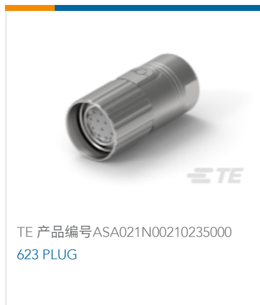
TE 产品编号ASA021N00210235000 623 PLUG