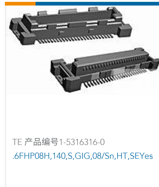
TE 产品编号1-5316316-0 .6FHP08H,140,S,GIG,08/Sn,HT,SEYes