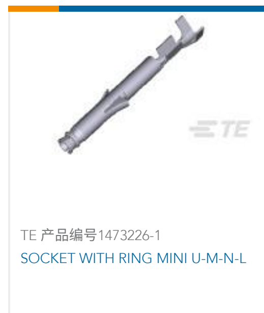
TE 产品编号1473226-1 SOCKET WITH RING MINI U-M-N-L