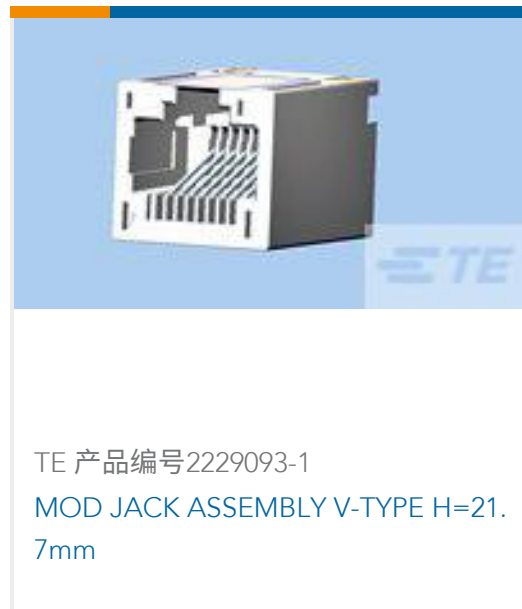
TE 产品编号2229093-1 MOD JACK ASSEMBLY V-TYPE H=21. 7mm