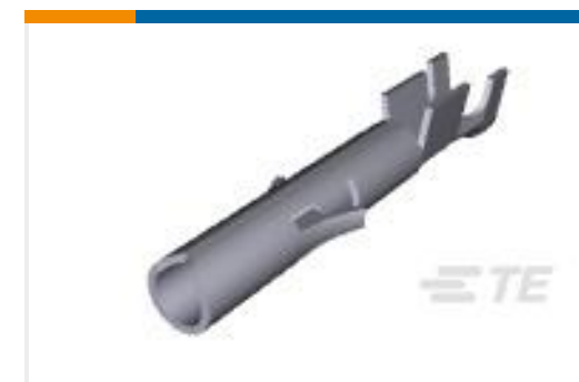
TE 产品编号350851-1 UMNL SOK 24-18 PTPBR