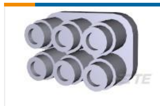
TE 产品编号794276-1 06P UMNL WIRE SEAL