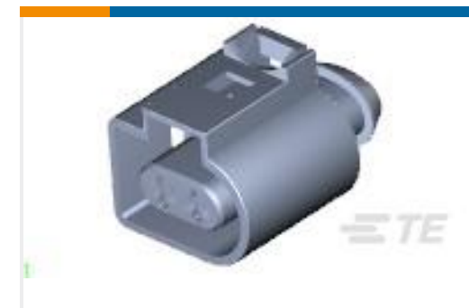
TE 产品编号1-1355200-1 MCP2,8BU-GEH ASSY2P