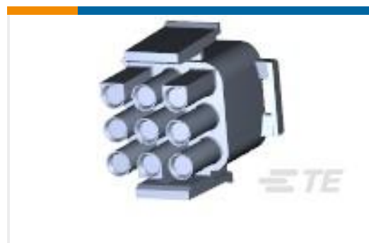
TE 产品编号350720-1 09P UMNL PLUG HSG