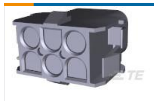
TE 产品编号1-480705-0 06P UMNL CAP HSG NATL