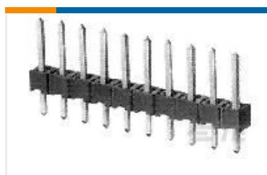
TE 产品编号3-826629-6 1X36 POS AMPMODU II HEADER