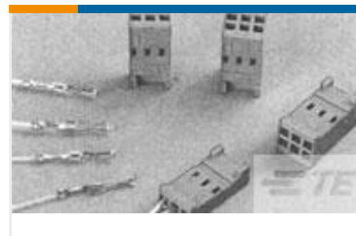
TE 产品编号188744-1 CONTACT REC HE14 COSI TIN PLATED