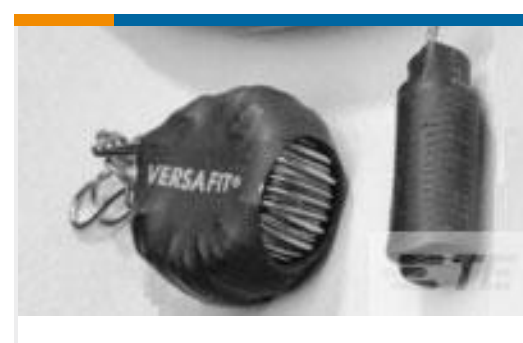
TE 产品编号129323P002 VERSAFIT-3/16-0-0.5IN-ST