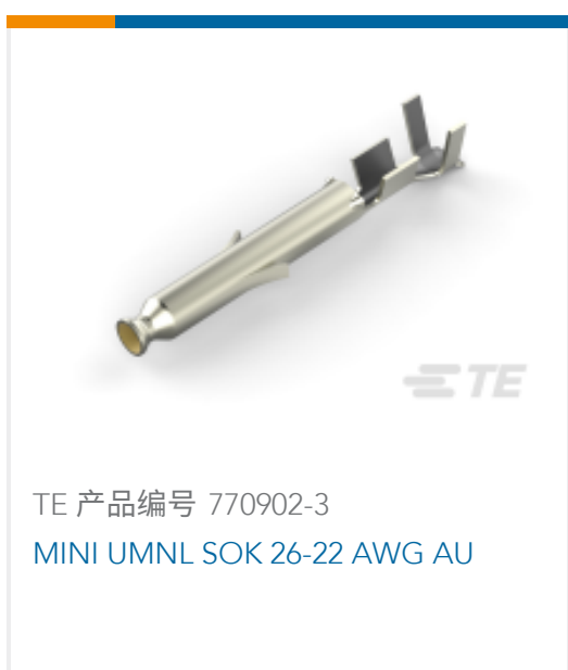
TE 产品编号 770902-3 MINI UMNL SOK 26-22 AWG AU