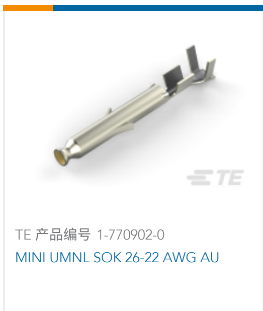
TE 产品编号 1-770902-0 MINI UMNL SOK 26-22 AWG AU