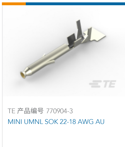
TE 产品编号 770904-3 MINI UMNL SOK 22-18 AWG AU