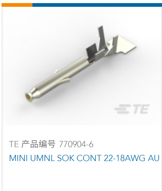
TE 产品编号 770904-6 MINI UMNL SOK CONT 22-18AWG AU