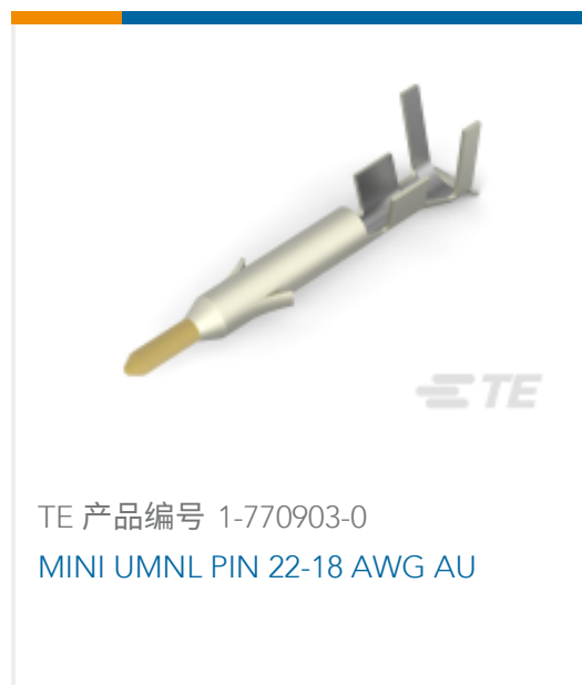
TE 产品编号 1-770903-0 MINI UMNL PIN 22-18 AWG AU