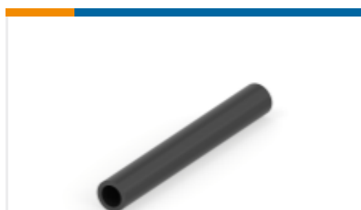
TE 产品编号NB32776001 ATUM-6/2-0-50MM