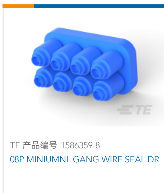
TE 产品编号 1586359-8 08P MINIUMNL GANG WIRE SEAL DR