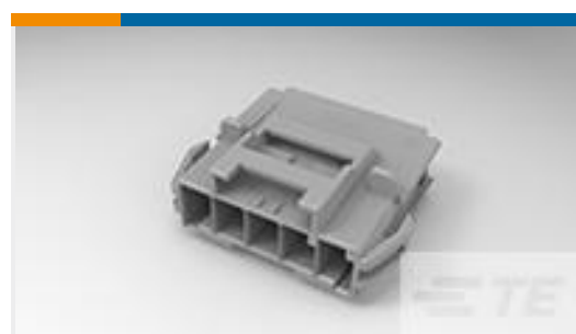
TE 产品编号5-1971772-7 PTL 1X5 CAP PANEL MT HITEMP KEY A LGR