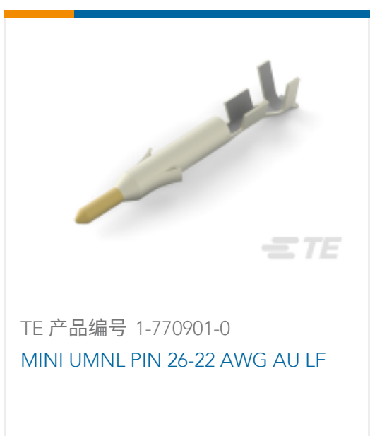
TE 产品编号 1-770901-0 MINI UMNL PIN 26-22 AWG AU LF