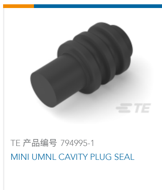
TE 产品编号 794995-1 MINI UMNL CAVITY PLUG SEAL