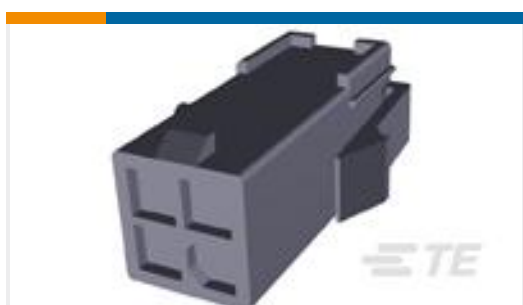
TE 产品编号794939-1 04P MINI UMNL CAP HSG