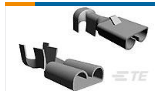
TE 产品编号180384-5 FF 250 REC 4-6MM2 TPPB LP