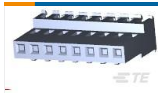
TE 产品编号3-640604-8 08P MTA156 CONN ASSY 18AWG LF