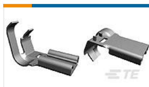
TE 产品编号41531 250 FASTON FLAG REC 18-12 AWG BR