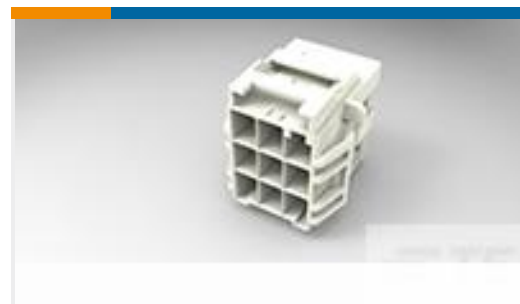
TE 产品编号1-1971875-3 PTL 3X3 CAP PANEL MT STD TEMP KEY A NAT