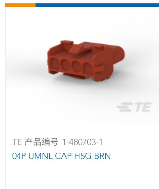
TE 产品编号 1-480703-1 04P UMNL CAP HSG BRN