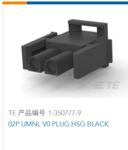
TE 产品编号 1-350777-9 02P UMNL V0 PLUG HSG BLACK