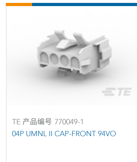
TE 产品编号 770049-1 04P UMNL II CAP-FRONT 94VO