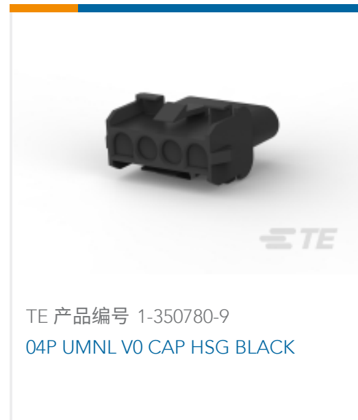
TE 产品编号 1-350780-9 04P UMNL V0 CAP HSG BLACK