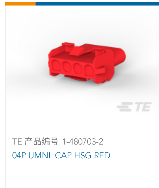
TE 产品编号 1-480703-2 04P UMNL CAP HSG RED