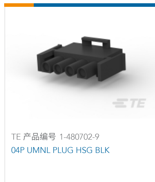
TE 产品编号 1-480702-9 04P UMNL PLUG HSG BLK