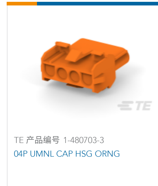
TE 产品编号 1-480703-3 04P UMNL CAP HSG ORNG