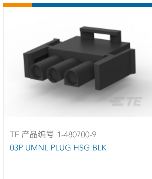
TE 产品编号 1-480700-9 03P UMNL PLUG HSG BLK