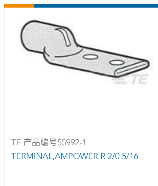
TE 产品编号55992-1 TERMINAL,AMPOWER R 2/0 5/16