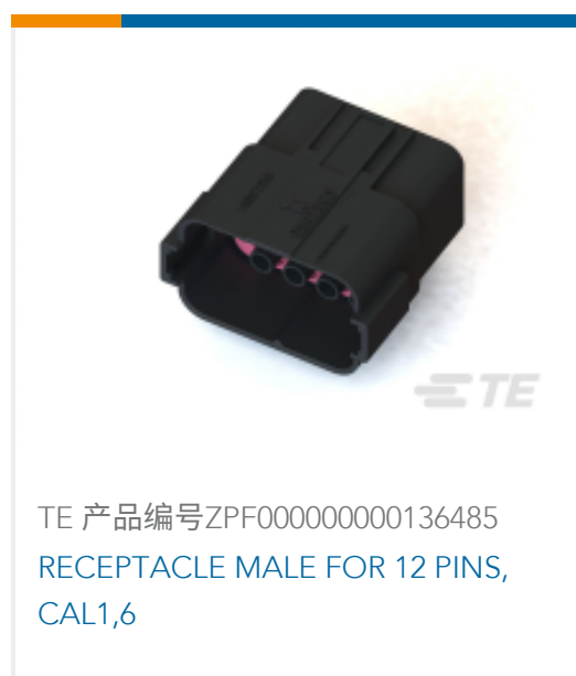
TE 产品编号ZPF000000000136485 RECEPTACLE MALE FOR 12 PINS, CAL1,6