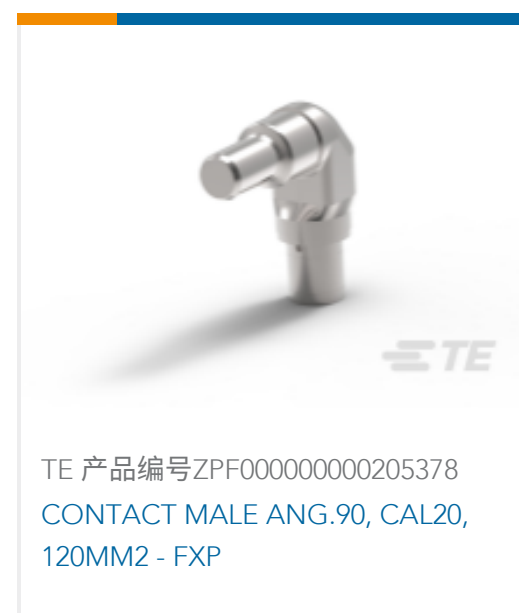
TE 产品编号ZPF000000000205378 CONTACT MALE ANG.90, CAL20, 120MM2 - FXP