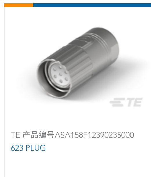
TE 产品编号ASA158F12390235000 623 PLUG