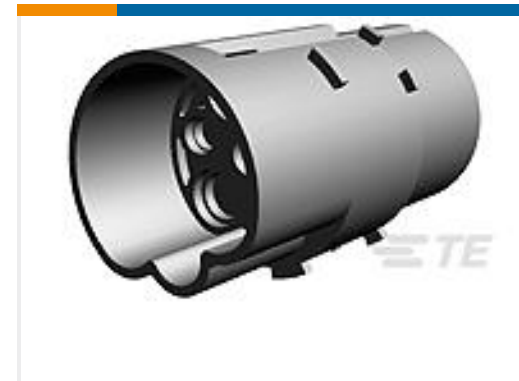
TE 产品编号927395-1 07P CI2/MNL.MALE HS