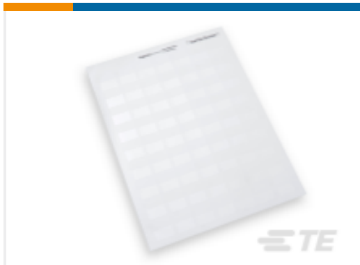
TE 产品编号8-1768016-6 CSL-03425P-4