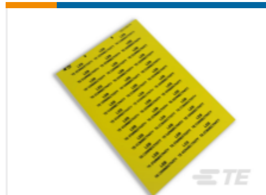
TE 产品编号7-1768033-0 LEB-1318P-4