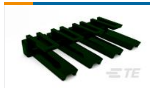
TE 产品编号1-2132782-2 12 pos. EP II breakaway retain