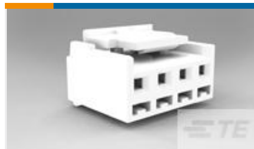
TE 产品编号2132781-7 07P EP-II HOUSING, NATURAL