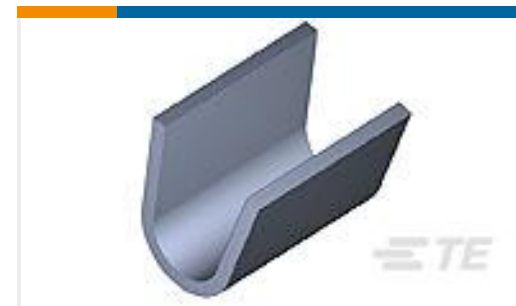
TE 产品编号485043-1 SPLICE 4000-9000 .020 BR