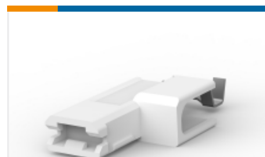
TE 产品编号521597-2 ULTRA-POD: 旗形, 母端组件, 镀锡, 0.187 英寸