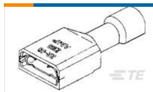
TE 产品编号3-520276-2 ULTRA-FAST 187 ASY REC 16-14 AWG TPBR