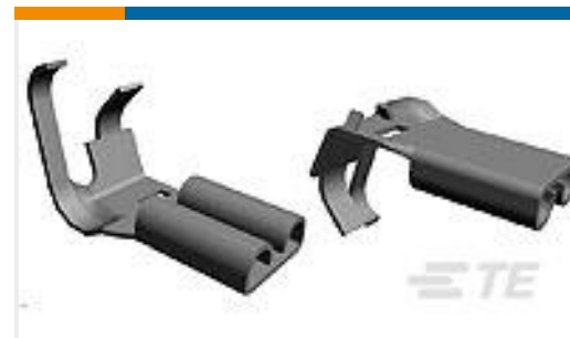
TE 产品编号42486-2 187 FASTON FLAG REC 20-16 AWG TPBR