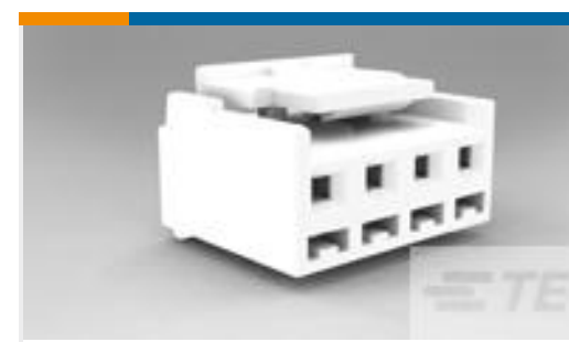
TE 产品编号2132781-3 03P EP-II HOUSING, NATURAL