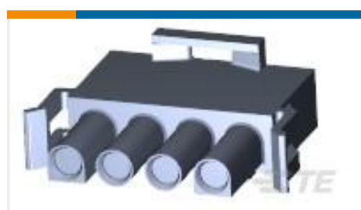
TE 产品编号2029387-1 04P UMNL SHORT LATCH PLUG V0