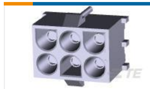
TE 产品编号643423-1 06P UMNL HDR ASSY POL