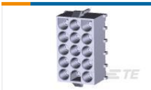
TE 产品编号643429-1 15P UMNL HDR ASSY POL