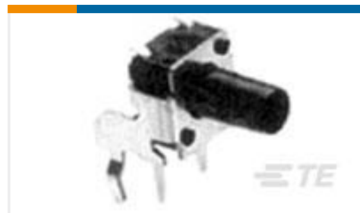
TE 产品编号1-1825027-1 FSMRA4JH04=R/A,TACT PB SW,160G