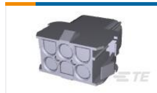
TE 产品编号350781-1 06P UMNL CAP HSG