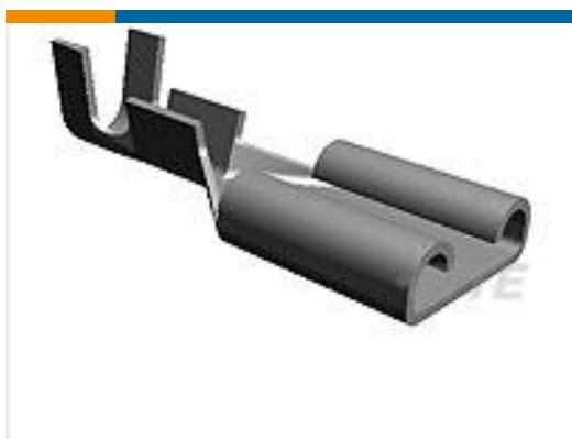
TE 产品编号42617-2 187 FASTON REC 20-16 AWG TPBR