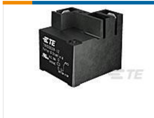
TE 产品编号4-1419148-8 T9AV1D22-18U