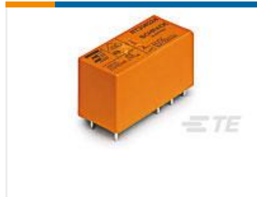
TE 产品编号2-1415898-3 RTS3LA12