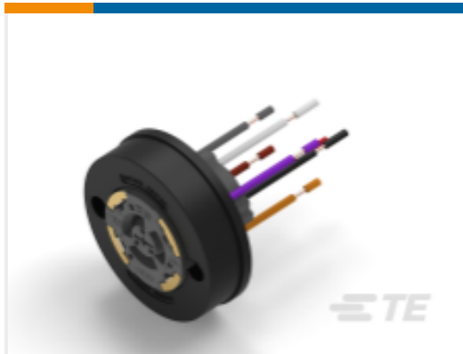
TE 产品编号2213627-2 ASSEMBLY, ROT DIM REC 49.22MM 7 POS 150C