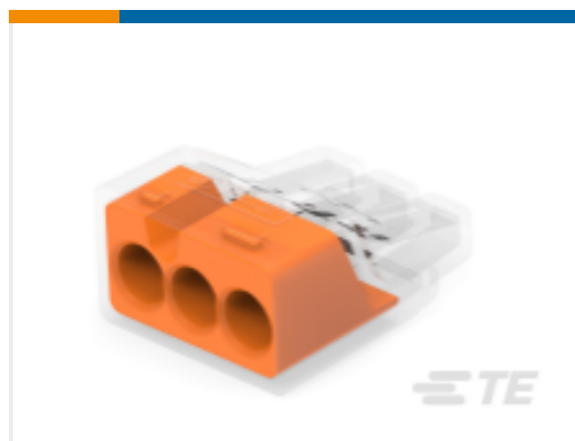
TE 产品编号2388553-3 PUSH-IN CONNECTOR, 3 POS