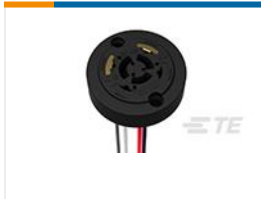
TE 产品编号2213362-2 Rcpt Assy,Dimmable Photocontrol, 150C,3/4