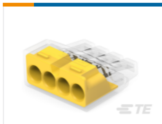
TE 产品编号2388553-4 PUSH-IN CONNECTOR, 4 POS