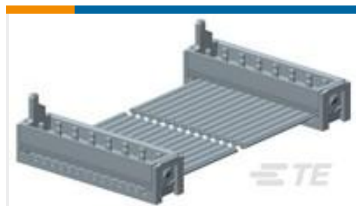
TE 产品编号1483355-1 MICRO-MATCH LEAD 14P 100MM