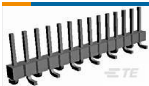
TE 产品编号1241150-6 6P MOD II BREAK AWAY HDR , SMD, BLISTER