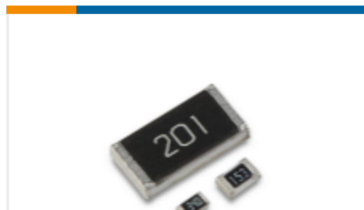
TE 产品编号2176329-3 CRGP 1210 15R 1%