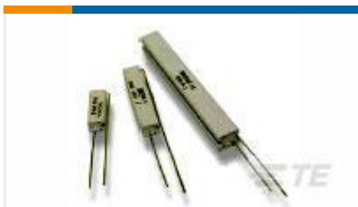
TE 产品编号1-1623728-7 BCHE 11 W 33R 5%