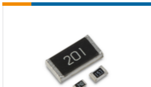
TE 产品编号4-2176328-6 CRGP 1206 56K 1%