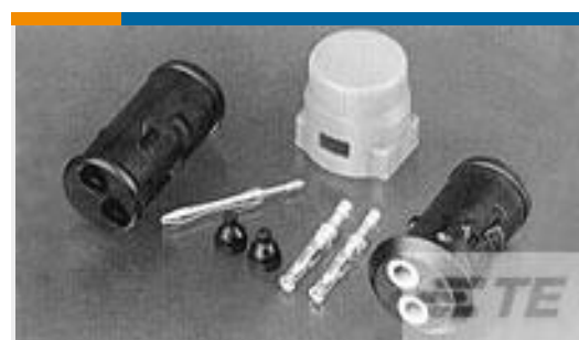
TE 产品编号826884-2 HSG ECONOSEAL 2 POS GERMANY