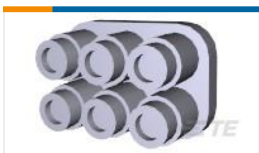
TE 产品编号794276-1 06P UMNL WIRE SEAL