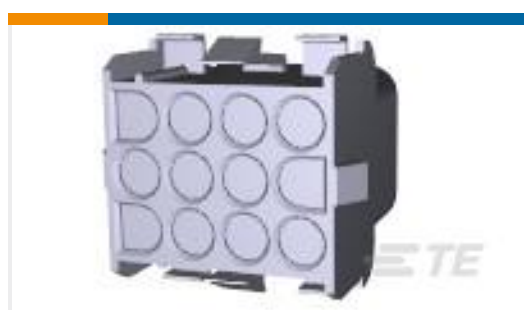
TE 产品编号1-480709-0 12P UMNL CAP HSG NATL