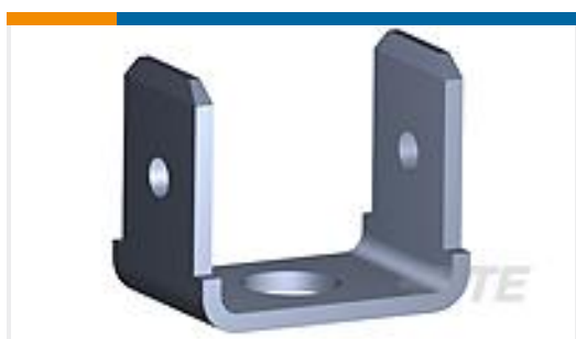
TE 产品编号41292 250 FASTON,TAB,BR