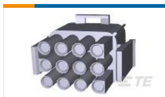
TE 产品编号1-480708-0 12P UMNL PLUG HSG NATL