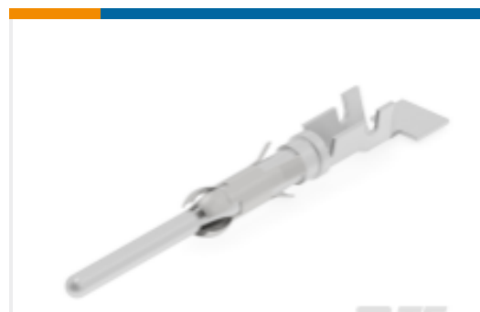
TE 产品编号926981-2 CI 2 PIN