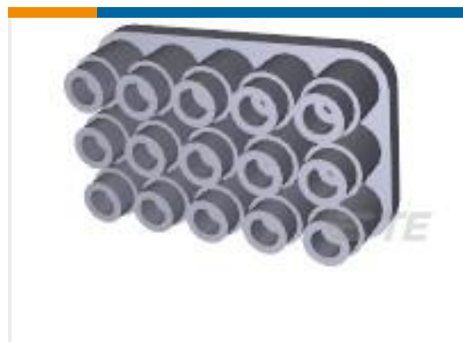
TE 产品编号794282-1 15P UMNL WIRE SEAL