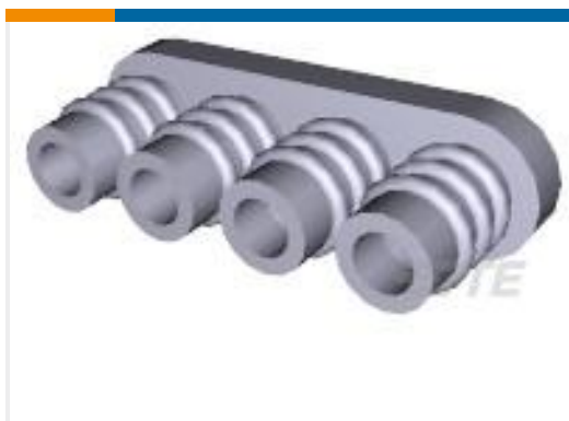
TE 产品编号794274-1 04P UMNL WIRE SEAL