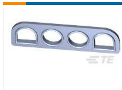
TE 产品编号794273-1 04P UMNL INTERFACE SEAL