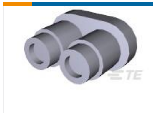
TE 产品编号794270-1 02P UMNL WIRE SEAL