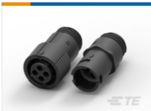
TE 产品编号1445390-1 Mini Circular Plastic Connectors (CPC)