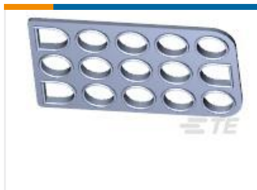
TE 产品编号794281-1 15P UMNL INTERFACE SEAL