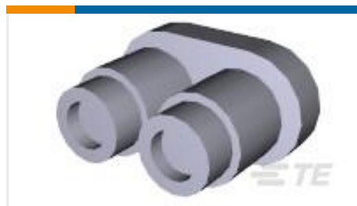
TE 产品编号794270-1 02P UMNL WIRE SEAL