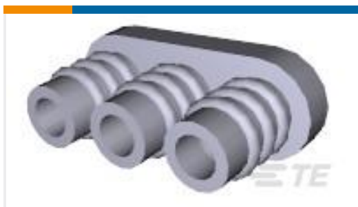
TE 产品编号794272-1 03P UMNL WIRE SEAL