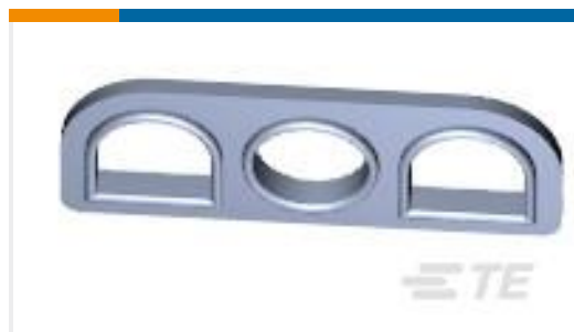
TE 产品编号794271-1 03P UMNL INTERFACE SEAL