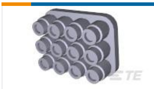
TE 产品编号794280-1 12P UMNL WIRE SEAL