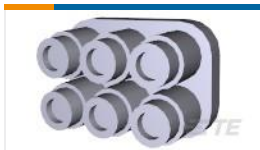
TE 产品编号794276-1 06P UMNL WIRE SEAL