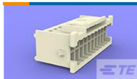
TE 产品编号2-1969540-0 HOUSING, PLUG, 20P, DUAL ROW, EP2.5