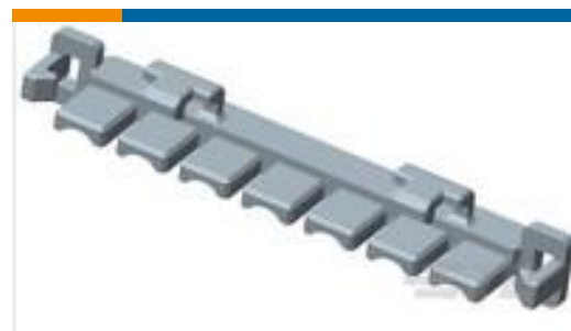
TE 产品编号1969609-4 4P VAL-U-LOK TPA 26-22 AWG