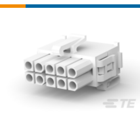
TE 产品编号 794196-1 10P MINI UMNL2 PLUG HSG UL94V0