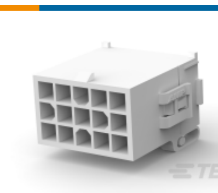
TE 产品编号 794205-1 15P MINI UMNL2 CAP HSG UL94V0