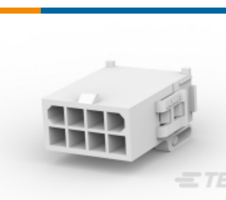
TE 产品编号 794193-1 08P MINI UMNL2 CAP HSG UL94V0