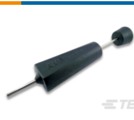
TE 产品编号 189727-1 EXTRACTION TOOL