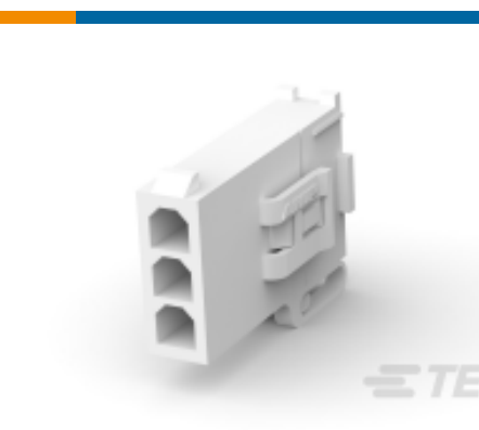
TE 产品编号 794187-1 03P MINI UMNL2 CAP HSG UL94V0