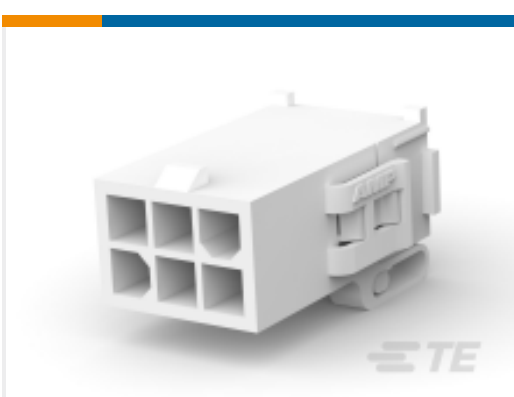
TE 产品编号 794191-1 06P MINI UMNL2 CAP HSG UL94V0