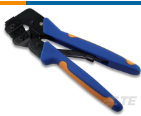
TE 产品编号 90759-1 PROCRIMP TL W/DIE MIN UNIV MNL