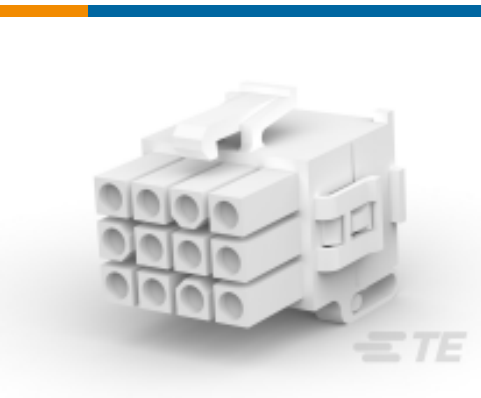
TE 产品编号 794200-1 12P MINI UMNL2 PLUG HSG MATRIX