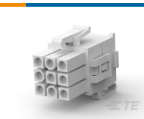
TE 产品编号 794194-1 09P MINI UMNL2 PLUG HSG UL94V0