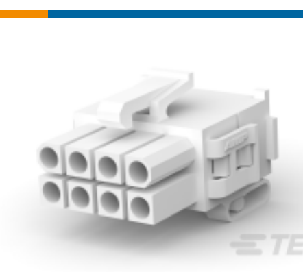
TE 产品编号 794192-1 08P MINI UMNL2 PLUG HSG UL94V0