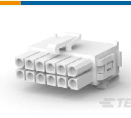
TE 产品编号 794198-1 12P MINI UMNL2 PLUG HSG DBLROW