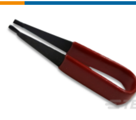
TE 产品编号 455830-1 INSERTION TOOL