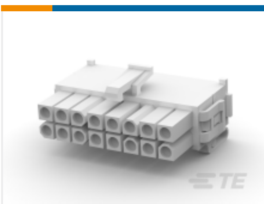
TE 产品编号 794206-1 16P MINI UMNL2 PLUG HSG UL94V0