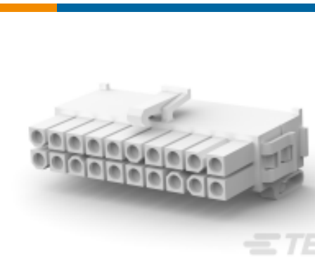
TE 产品编号 794210-1 20P MINI UMNL2 PLUG HSG UL94V0