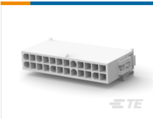
TE 产品编号 794215-1 24P MINI UMNL2 CAP HSG UL94V0