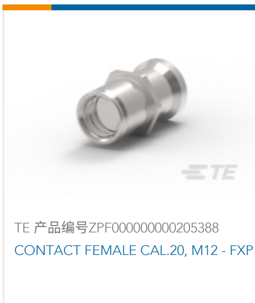
TE 产品编号ZPF000000000205388 CONTACT FEMALE CAL.20, M12 - FXP