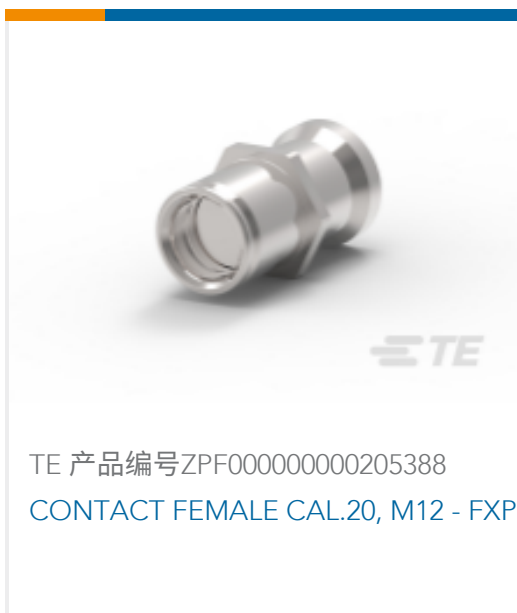
TE 产品编号ZPF000000000205388 CONTACT FEMALE CAL.20, M12 - FXP