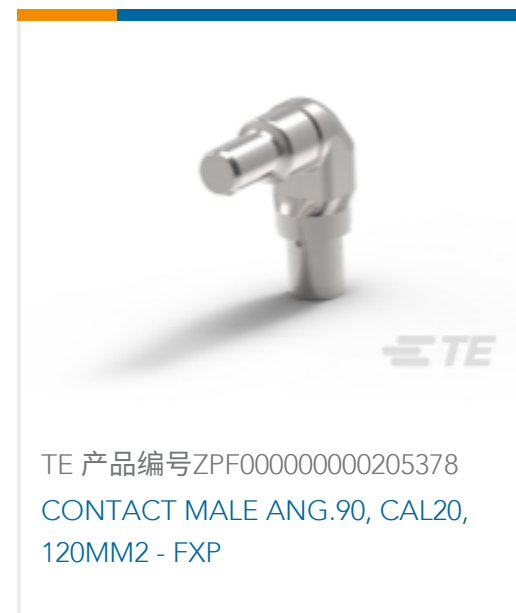
TE 产品编号ZPF000000000205378 CONTACT MALE ANG.90, CAL20, 120MM2 - FXP