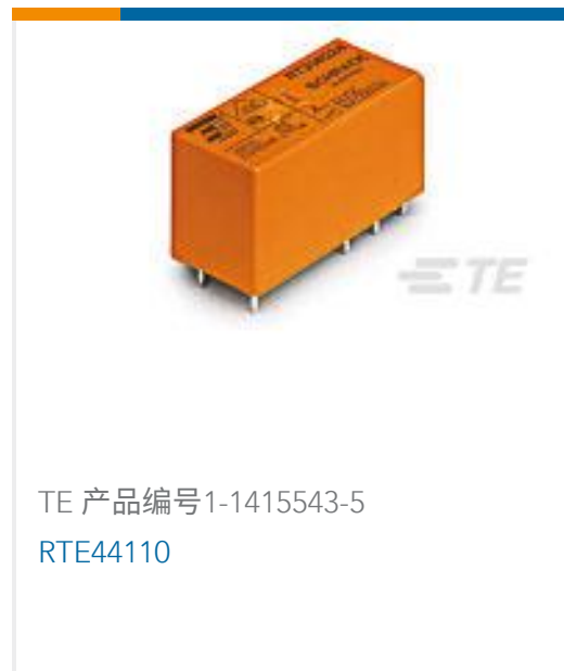
TE 产品编号1-1415543-5 RTE44110