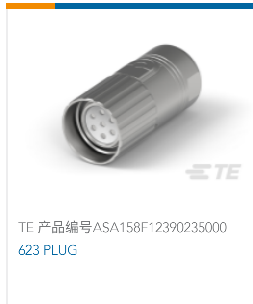
TE 产品编号ASA158F12390235000 623 PLUG