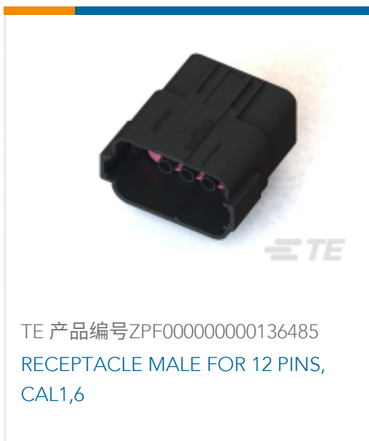
TE 产品编号ZPF000000000136485 RECEPTACLE MALE FOR 12 PINS, CAL1,6