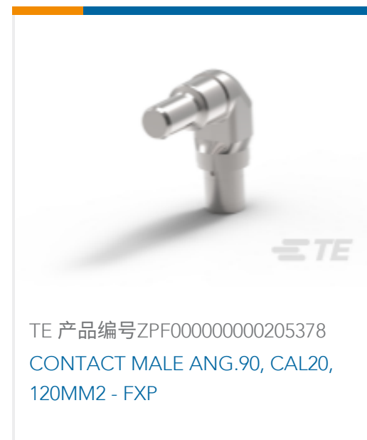
TE 产品编号ZPF000000000205378 CONTACT MALE ANG.90, CAL20, 120MM2 - FXP