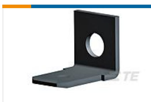
TE 产品编号63971-1 250 FASTON TAB TPBR