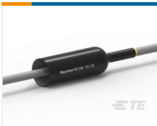
TE 产品编号CU4602-000 WCSM-90/25-1000/S(S5)