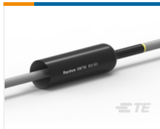
TE 产品编号397206-000 MWTM-160/50-500/S