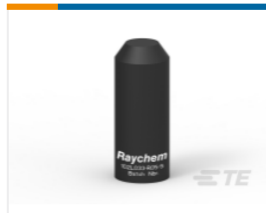
TE 产品编号BM5710N002 102L033-R05/S(S25)