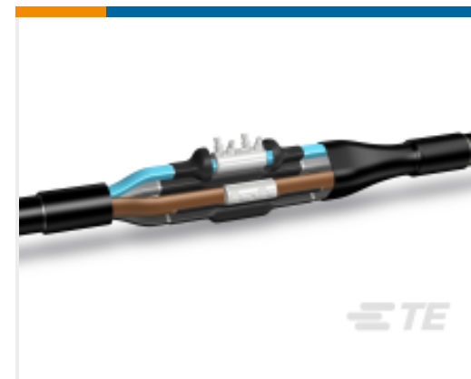
TE 产品编号CY1544-000 LJSM-4X095-240-PP