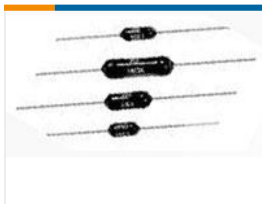
TE 产品编号3-1879619-5 H8 270R 1% 25PPM