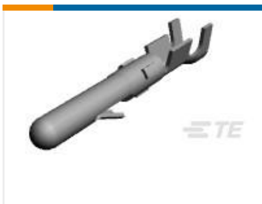
TE 产品编号61116-7 CMNL PIN 24-18 AUNIBR