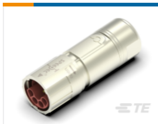
TE 产品编号HSA002N00590100000 723 HTEC PLUG, SPEEDTEC