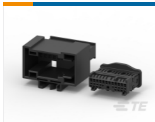
TE 产品编号1897711-2 MQS 连接器外壳