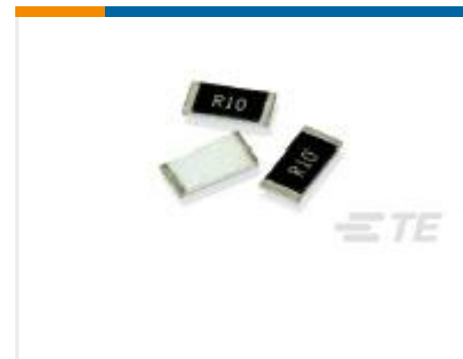
TE 产品编号2-1879463-2 RL73H 2E R75 1% 5K RL