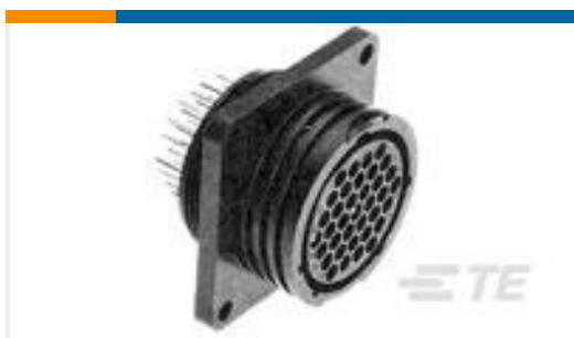
TE 产品编号1-213828-1 CPC RCPT ASSY 23-37,W/KEY PLUG