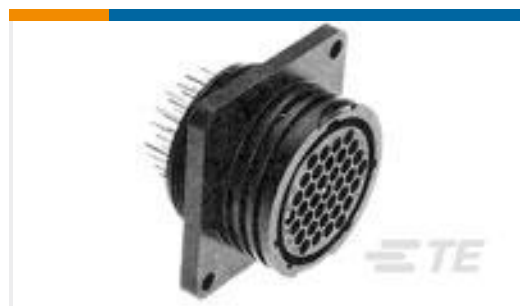
TE 产品编号213826-8 CPC RCPT ASSY 17-9,W/KEY PLUG