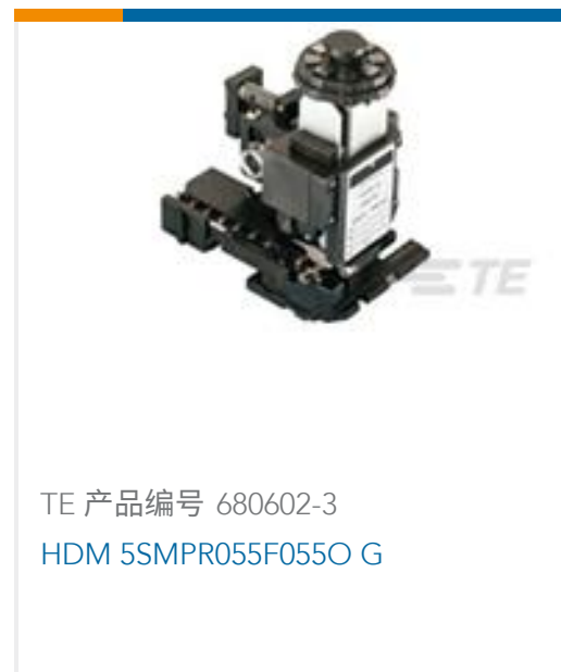
TE 产品编号 680602-3 HDM 5SMPR055F055O G