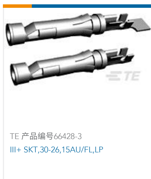
TE 产品编号66428-3 III+ SKT,30-26,15AU/FL,LP