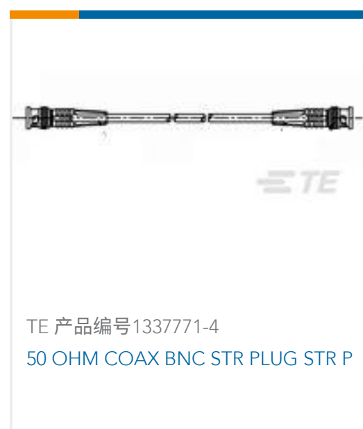
TE 产品编号1337771-4 50 OHM COAX BNC STR PLUG STR P