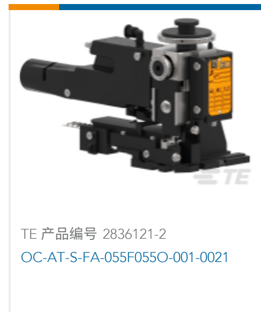
TE 产品编号 2836121-2 OC-AT-S-FA-055F055O-001-0021