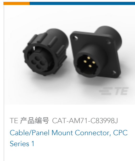
TE 产品编号 CAT-AM71-C83998J Cable/Panel Mount Connector, CPC Series 1