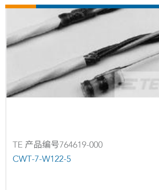
TE 产品编号764619-000 CWT-7-W122-5