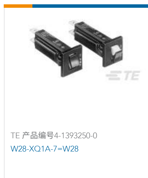
TE 产品编号4-1393250-0 W28-XQ1A-7=W28