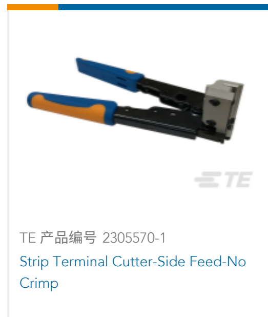
TE 产品编号 2305570-1 Strip Terminal Cutter-Side Feed-No Crimp