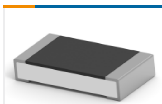
TE 产品编号3-2176390-2 RQ 1206 2K43 0.1% 10PPM 5K RL