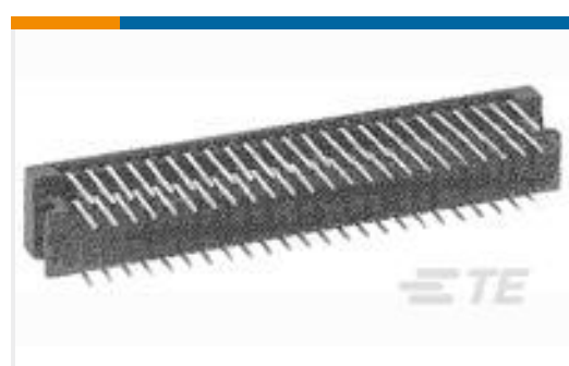
TE 产品编号5-534974-8 150 MODII HORZ 2PC 3R CE 100CL