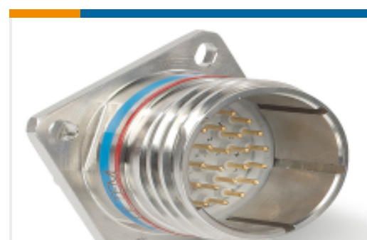
TE 产品编号YDTS20W23-55SBV001 RECP ASSY