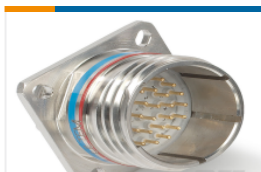
TE 产品编号YDTS20W23-55SBV001 RECP ASSY