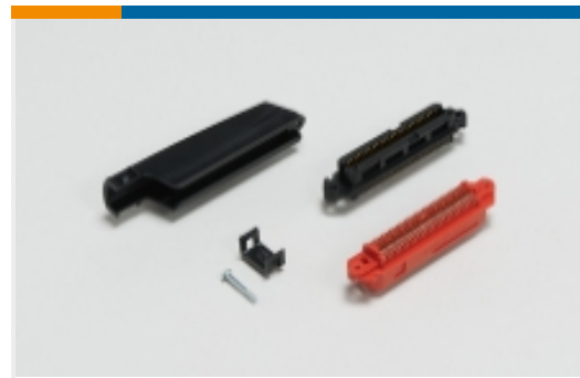
IDC D-Sub 连接器(74)