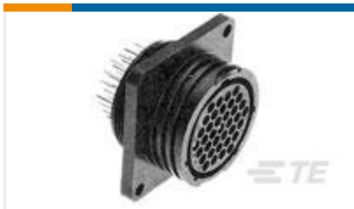
TE 产品编号1-213781-0 CPC RCPT ASSY SIZE 23-19,S/L