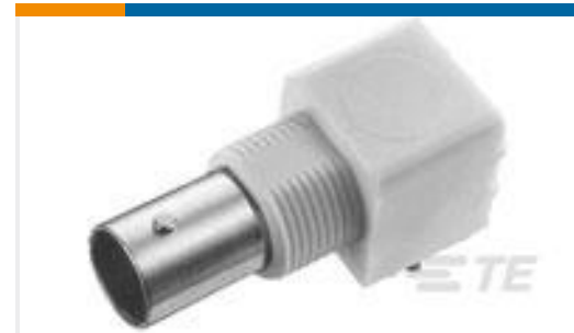
TE 产品编号5415105-2 JACK,R/A,75 OHM,BNC PCB