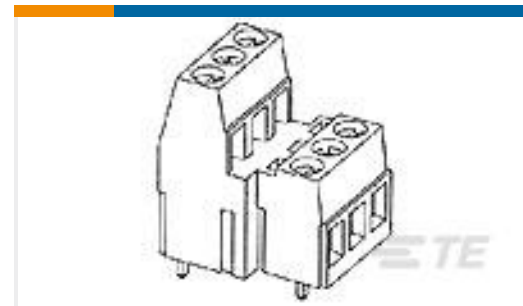
TE 产品编号282888-7 TERMI-BLOK PCB 9 POS. 5 mm PIT