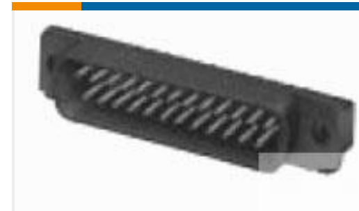
TE 产品编号745055-1 50 PLUG SP/AP INSRT