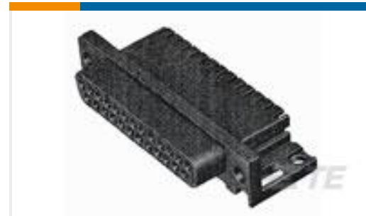
TE 产品编号5745085-2 HD-20 RCPT 25P RA 478