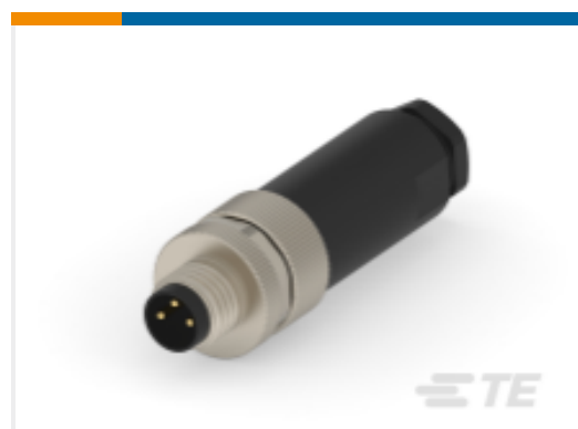
TE 产品编号T4011008031-000 M8,SCREW, MALE,S,UNSHIELD,3P, GOLD