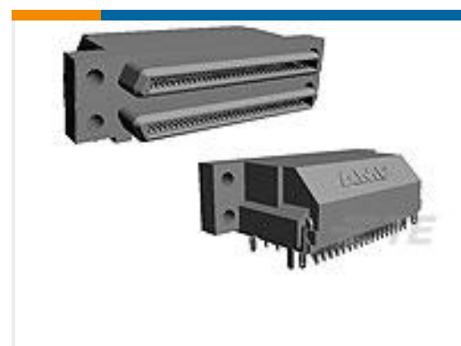
TE 产品编号5787962-2 .8MM CHAMP STACK RCPT ASSY