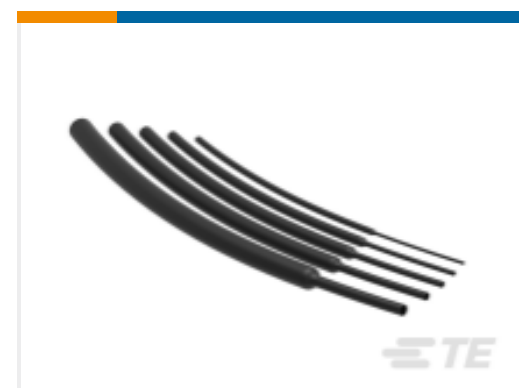
TE 产品编号NB18932001 RNF-100-1/4-BK-STK