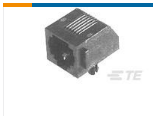
TE 产品编号5555163-1 MJ,LPF,R/A,6P/6C,PNL STOPS,BU