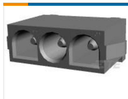
TE 产品编号350429-1 03P UMNL PIN HDR ASSY NATL