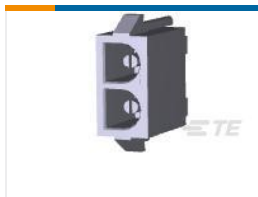
TE 产品编号641963-1 02P UMNL PIN HDR ASSY POL NATL