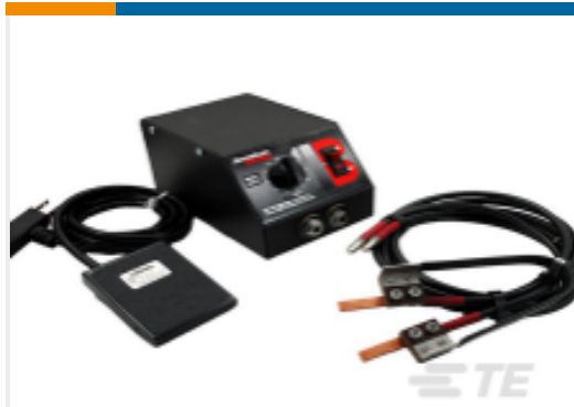
TE 产品编号 173643-000 RH-3960-1-TINEL-KIT-120V