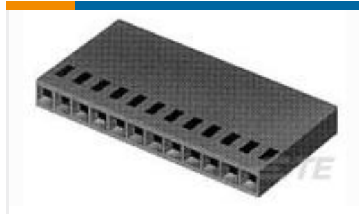
TE 产品编号2-87499-9 16 MODIV HSG SR MRKD .100CL