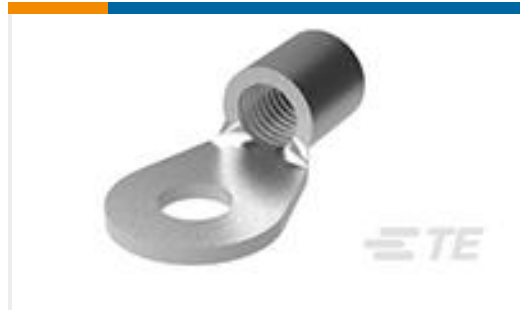
TE 产品编号33465 TERMINAL,SOLIS R 6 1/4