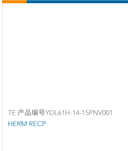
TE 产品编号YDL61H-14-15PNV001 HERM RECP