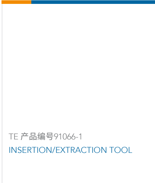
TE 产品编号91066-1 INSERTION/EXTRACTION TOOL