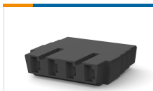
TE 产品编号926728-1 FF 110 REC HSG 4P NYLON BLACK