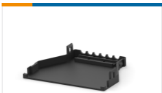
TE 产品编号1776695-1 Strain Relief, D5200, Dynamic AU,TB