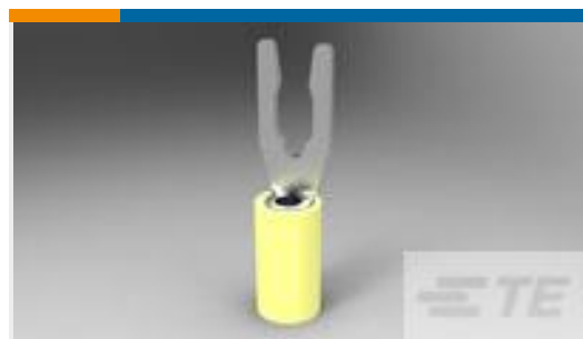
TE 产品编号52430-3 TERMINAL,PIDG SPR SPD 12-10 6