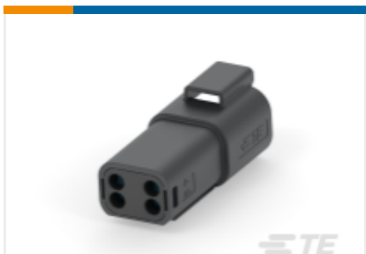
TE 产品编号1-2600030-0 4CCT BLACK RECEP W/LARGE SEAL