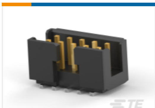
TE 产品编号1-2373376-0 10P,2MM,SHRD HDR,DRVT,SMD,0.1 AU,TB