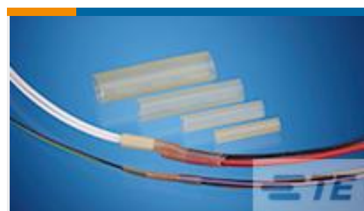
TE 产品编号7121976001 RBK-VWS-125-NR3-X-65MM