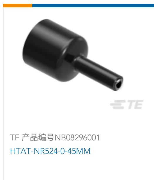
TE 产品编号NB08296001 HTAT-NR524-0-45MM