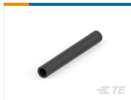
TE 产品编号0989076013 RBK-ILS 热缩管