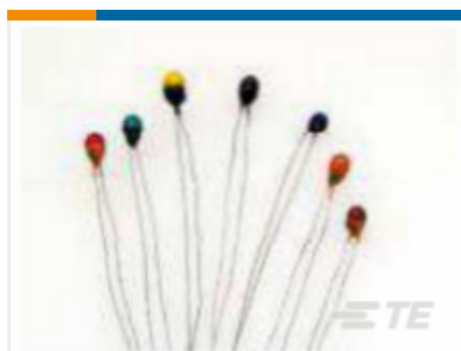
TE 产品编号SP44908X-19 NASA-Qualified Temperature Sensors, Model 44900 Series