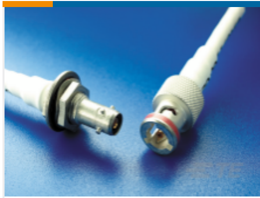
TE 产品编号858834-000 DK-621-L933-1S