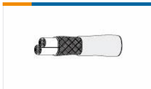
TE 产品编号702841-000 55A1821-22-9/96-9CS2275