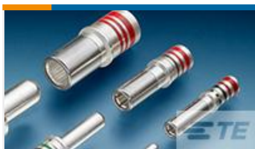
TE 产品编号 0662-207-0882 CONT SOC ASSY