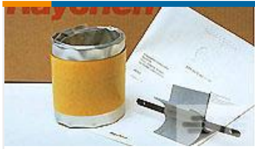
TE 产品编号588693-000 RDSS-125(S10)