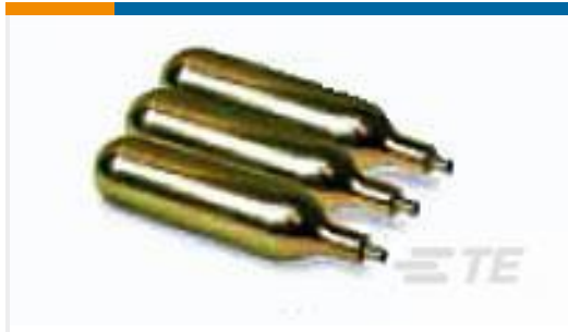
TE 产品编号985444-000 E7512-0160(B60)