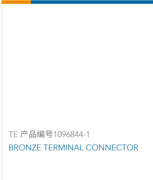
TE 产品编号1096844-1 BRONZE TERMINAL CONNECTOR