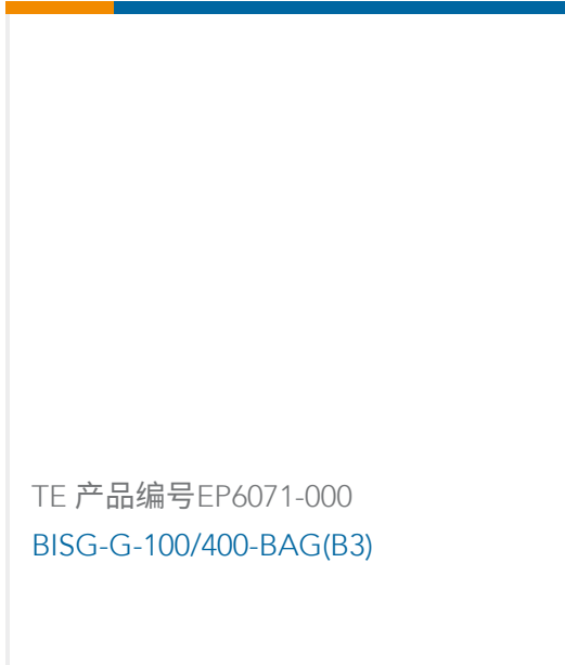
TE 产品编号EP6071-000 BISG-G-100/400-BAG(B3)