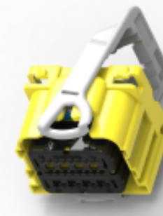
TE 产品编号 2098923-8 SDM,24P PLUG ASY,LHL,KEY A