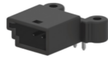
TE 产品编号953363-1 Signal Header