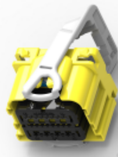
TE 产品编号 1-2098923-3 SDM,24P PLUG ASY,LHL,KEY A