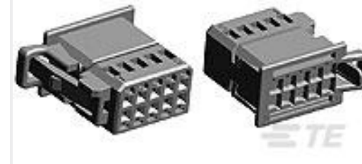
TE 产品编号1488973-1 10POS MQS REC