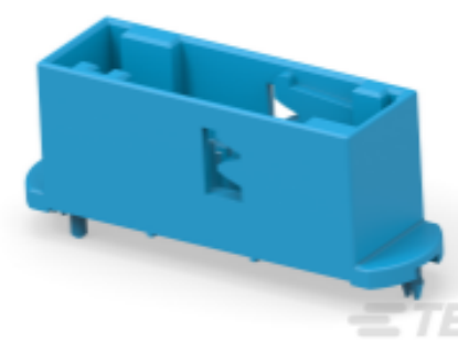
TE 产品编号9-966658-2 32pos MQS .63 header 180deg