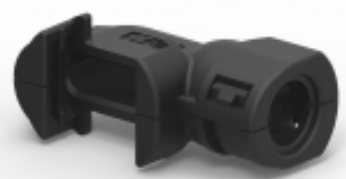
TE 产品编号2272169-1 MCON WIRE DRESS, 2P PLUG, RIGHT ANGLE