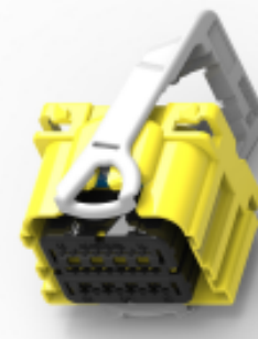
TE 产品编号 1-2098923-8 SDM,24P PLUG ASY,LHL,KEY A