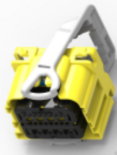
TE 产品编号 1-2098923-2 SDM,24P PLUG ASY,LHL,KEY A