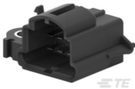
TE 产品编号282526-7 Low & Medium Power Header