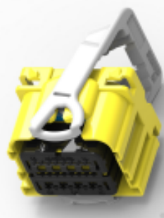
TE 产品编号 2098923-9 SDM,24P PLUG ASY,LHL,KEY A