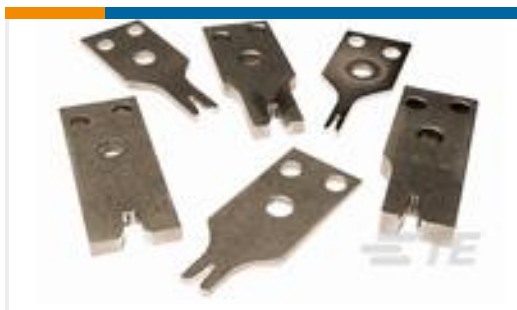
TE 产品编号2-458209-6 CRIMPER, WIRE "F"