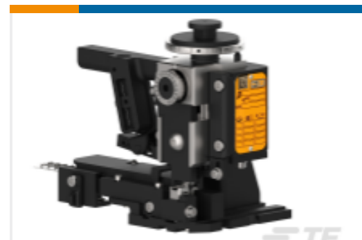
TE 产品编号2837157-1 OCEAN_2.0_Applicator-S-110F155O-RSM